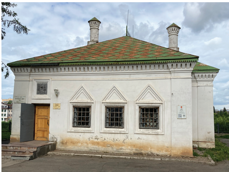
Домик Петра 1 в Вологде, 2020 г.

Подробное изучение таких мифов мы оставим для другой публикации, а ниже сосредоточимся на том, как в них вплетается международное измерение.