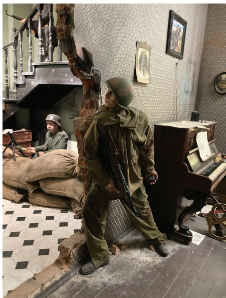
Фрагмент экспозиции Военно-исторического центра «Маршал Победы — Георгий Константинович Жуков», Калуга 2021 г.

русской наблюдательной вышкой и монгольской кибиткой. В Алексеевской башне Новгородского кремля (экспозиция 2020 г.), рассказывающей о гарнизоне крепости, ее штурме шведскими войсками в 1611 г. и последующей оккупации, одинаково представлены манекены шведских и русских солдат и офицеров.