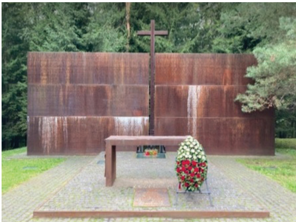
Мемориал в Катыни, фото 2021 г.

ветствующее заявление, и В.В. Путин, и Д.А. Медведев неоднократно высказывались на эту тему, не оставляя сомнений в том, кто именно осуществлял расстрелы.