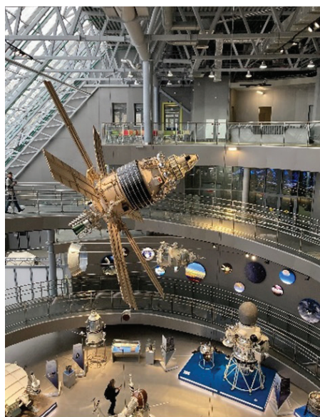
Фрагмент экспозиции Музея космонавтики, Калуга, 2021 г.

К этой же культурной логике мы готовы отнести работу местных культурно-политических элит по включению имеющихся объектов культурного наследия в список Всемирного наследия ЮНЕСКО, что имеет зна-