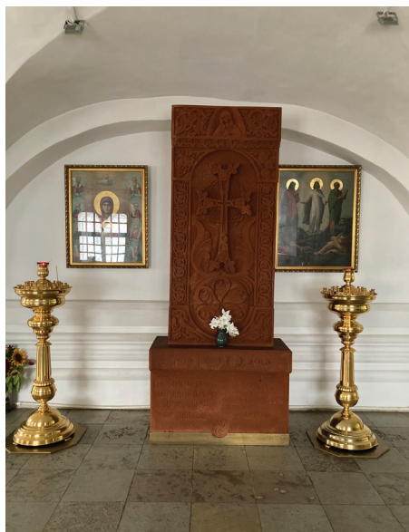
Памятный крест-хачкар в память 100-летия геноцида армян, Великий Новгород, 2021 г.

музейное пространство России, где рассказывается о геноциде цыган в годы Второй мировой войны). В Калуге отдельная экспозиция, посвященная имаму Шамилю (по завершении Кавказской войны около 10 лет он находился здесь в почетном плену), частично устроена на средства местной дагестанской диаспоры.