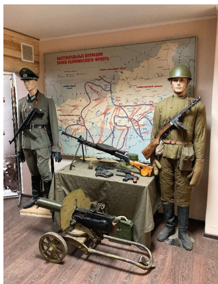
Фрагмент экспозиции «Четыре эпохи воинской славы», Тверь, 2020

Использование темы внешней угрозы вовсе не означает создание яркого, развернутого образа врага. Его презентация, преимущественно через упоминания, предметы вооружения и униформы, делает образ блеклым, скорее абстрактно-воображаемым. Чем глубже эпоха, тем легче музейные сотрудники идут на сопоставительный рассказ о противоборствующих армиях. Пожалуй, главным исключением является тверская интерактивная экспозиция «Четыре эпохи воинской славы», открытая в 2017 г. при местном от-