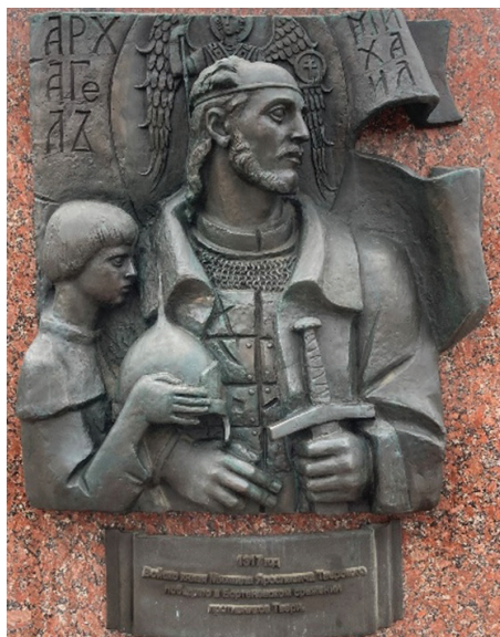
Барельеф с Михаилом Тверским на стеле Города воинской славы в Твери, 2020 г.

как на сопротивление собственно исторического материала, так и на наличие в среде тверской культурной элиты определенных антимосковских, регионалистских настроений. Образ Михаила Тверского лишь усиливает конфликт по линии «регион — центр — внешний мир».