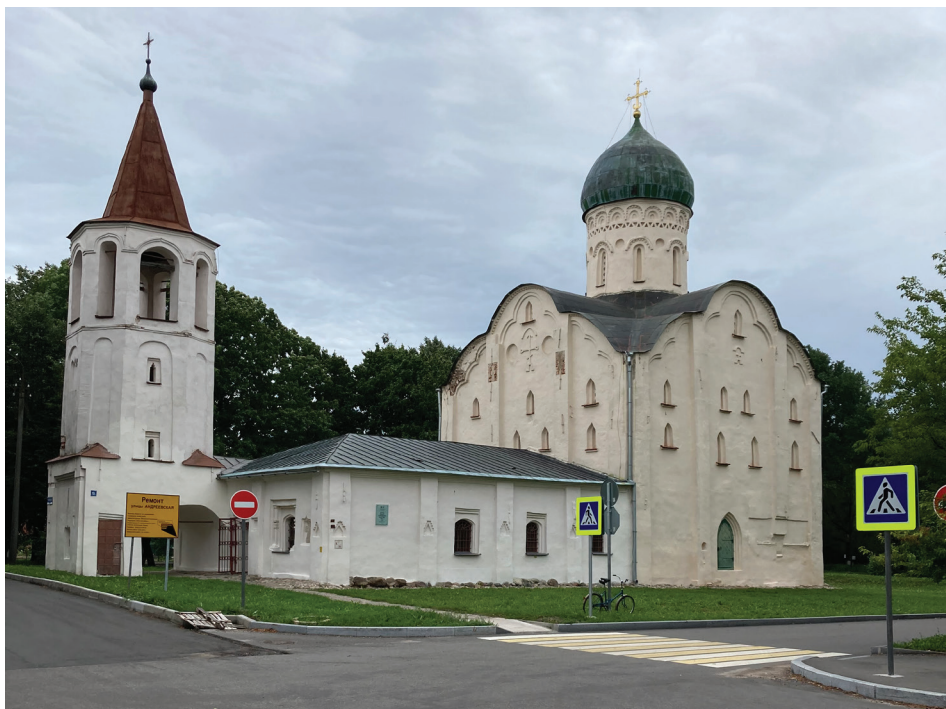
Церковь Феодора Стратилата на Ручью в Великом Новгороде, 2021

перспективу. Если бы она оставалась лишь достоянием летописей и трудов историков, то при особом рвении властей ее можно было бы ограничить лишь научными дискуссиями, однако этот ход несколько затруднителен. Часть предметов ювелирного искусства, выставленных во Владычной палате на территории кремля (XV век), созданы за рубежом: они призваны свидетельствовать о расцвете города, но неизбежно указывают на тесные торговые связи. Культурные контакты воплощены и в камне: так, элементы готики обнаруживаются в Церкви Феодора Стратилата на Ручью, а Владычная палата в полной мере относится к этому архитектурному стилю. Все это отражено в экспликациях и экскурсионных программах, тем самым русская древность предстает во взаимосвязи не