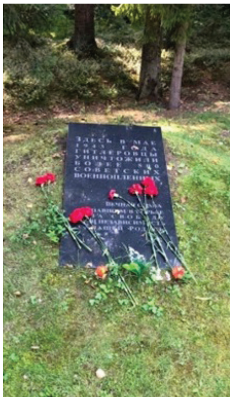
Плита-кенотаф о якобы убитых здесь советских военнопленных, фото 2021 г.

Следующий этап развития темы связан с Тверью, где в 2020 г. демонтировали на бывшем здании НКВД две мемориальные таблички — одна была посвящена репрессированным в целом, другая — расстрелянным полякам. Примечательной особенностью стало то, что местные власти стремились публично дистанцироваться от этого. Формальным поводом стало то, что якобы в начале 1990-х эти знаки были установлены без надлежащих документов. Это происходило на фоне активизации деятельности отрицателей ответственности НКВД за расстрелы в Катыни и Медном тверских, смоленских и московских общественников и некоторых лиц, имеющих научные степени по исто-